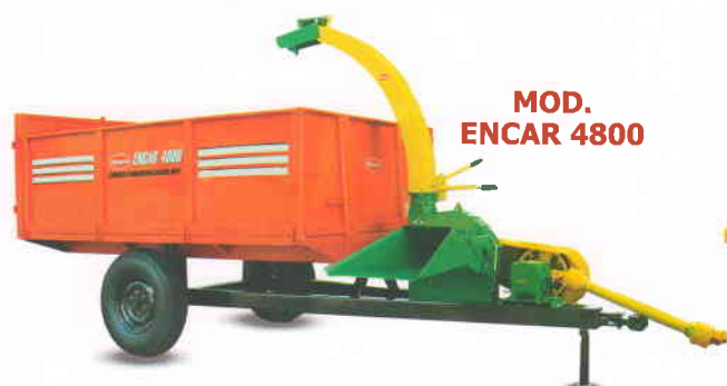
MOD. ENCAR 4800