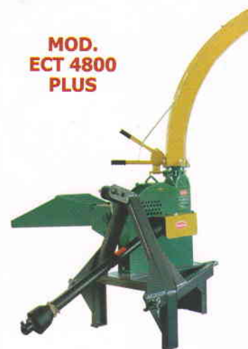
MOD. ECT 4800 PLUS