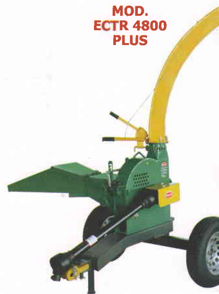
MOD. ECTR 4800 PLUS