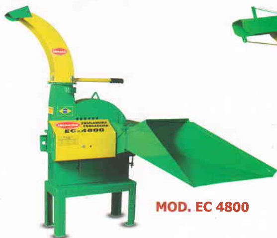
MOD. EC 4800