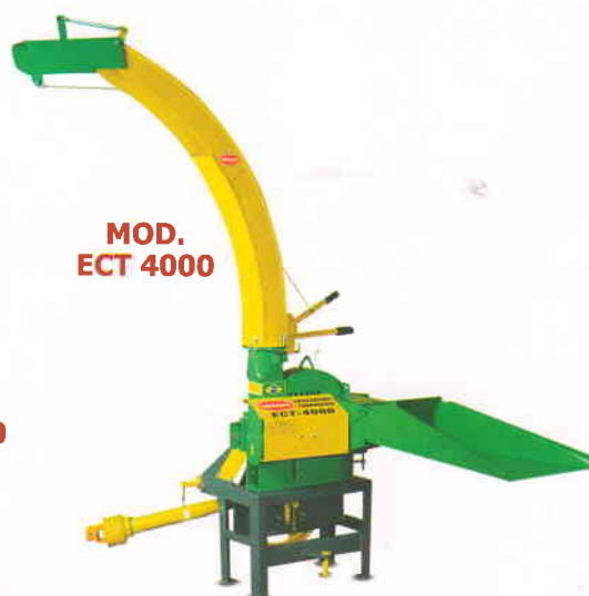
MOD. ECT 4000