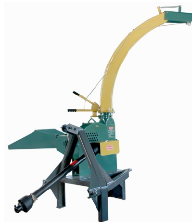
MOD. ECT-4000 T90° PLUS