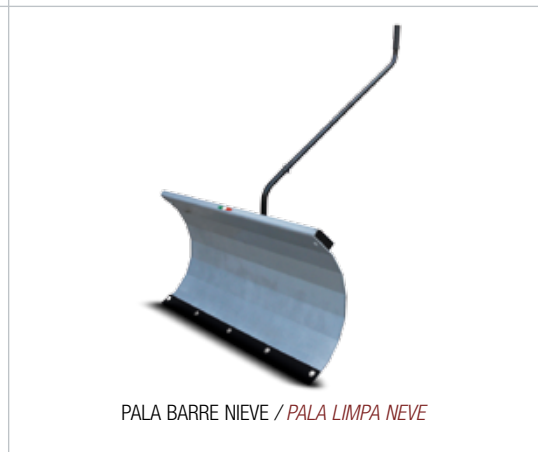
PALA BARRE NIEVE / PALA LIMPA NEVE