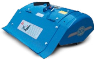
FRESAS / FRESAS

Múltiples son los empleos en los que los motocultores PowerSafe® pueden ser utilizados, además del clásico empleo en fresado. La reversibilidad de las manceras unida a las prestaciones de la toma de fuerza independiente, permiten a todos los modelos ser empleados tanto con aperos frontales como posteriores confirmando la gran versatilidad de estas máquinas. Los accionamientos estudiados de forma ergonómica reducen la fatiga del usuario de manera que puede disfrutar del confort y prestaciones de las máquinas de forma óptima.