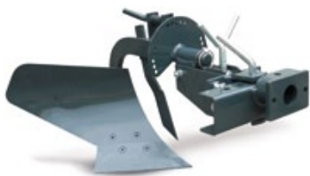
ARADO MONOSURCO / CHARRUA