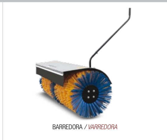
BARREDORA / VARREDORA