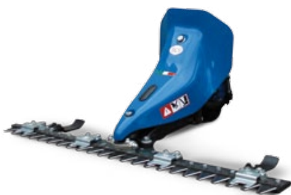
BARRA DE SIEGA / BARRA DE CORTE