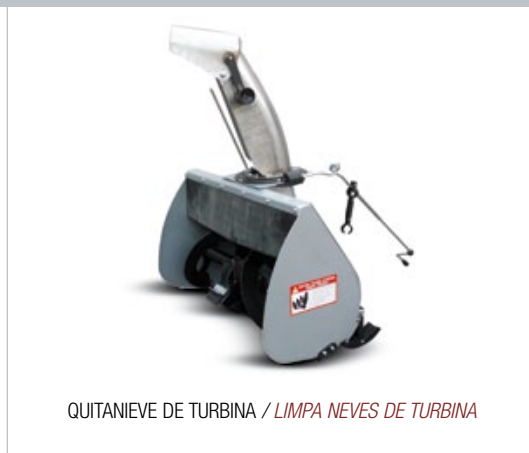
QUITANIEVE DE TURBINA / LIMPA NEVES DE TURBINA