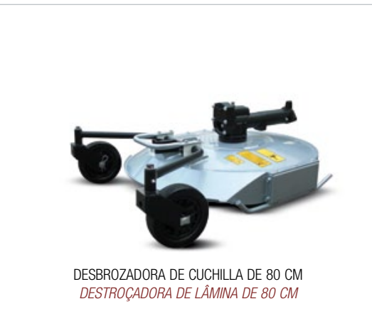
DESBROZADORA DE CUCHILLA DE 80 CM DESTROÇADORA DE LÂMINA DE 80 CM