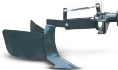
SURCADOR / ABRE-REGOS