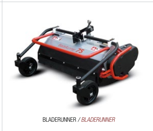
BLADERUNNER / BLADERUNNER