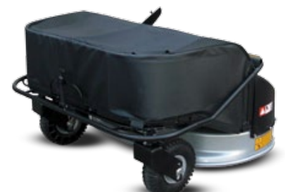
CORTACÉSPED 100 CM / CORTA RELVA DE 100 CM