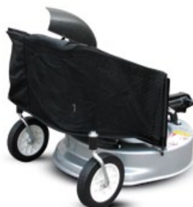
CORTACÉSPED 56 CM / CORTA RELVA 56 CM